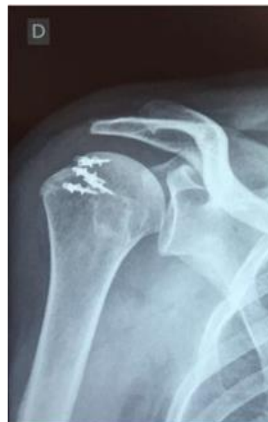
Figura 3 – Avaliação radiográfica pós-operatória.

No seguimento ambulatorial, após seis meses de pós-operatório, apresentou melhora significativa da funcionalidade do ombro, o que foi conferida pelas escalas de ASES e UCLA, na qual obteve a de 90 e 35, respectivamente, demonstrando o sucesso do procedimento cirúrgico.