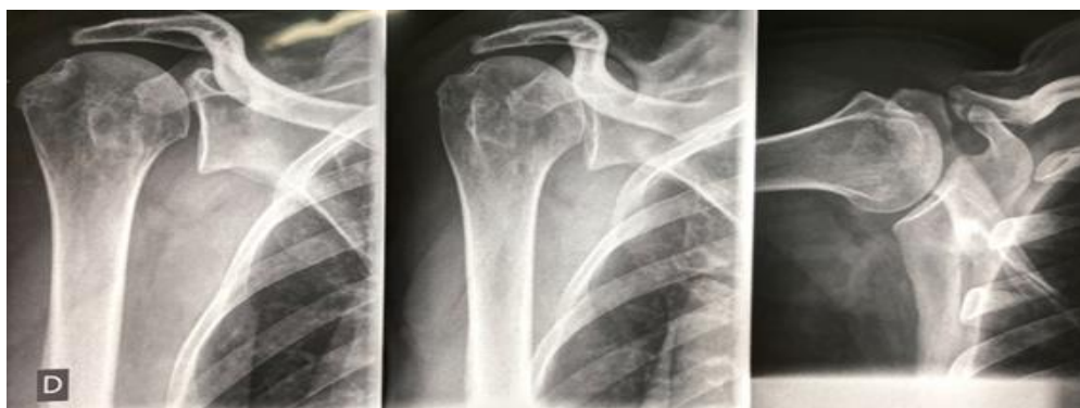
Figura 1 – Avaliação radiográfica Pré-operatória.

Apresentou achados radiográficos compatíveis com ruptura extensa do manguito rotador, com ascensão da cabeça umeral e com espaço subacromial menor que 7 mm, associado à perda do arco gótico do ombro ( Figura 1 ).